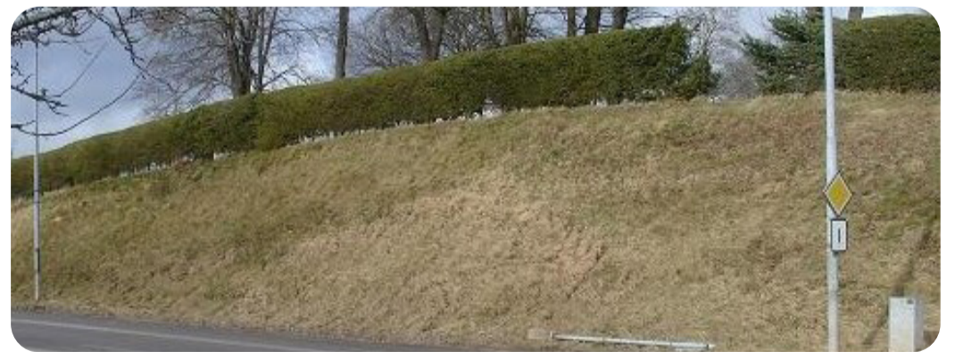
Kyrkogårdens sydslänt före restaurering.

Svartpälsbin måste ha öppen sand i varma miljöer för att kunna gräva ut sina underjordiska bon. Den öppna sanden gör det lätt att gräva och det blir väl-dränerat. Vilda bin har också höga krav på vilka växter som behöver finnas i närheten. Svartpälsbiet har till exempel en förkärlek för blåeld, oxtunga, fältvedel och olika arter av ärtväxter – flera av dessa finns nära kyrkogården.