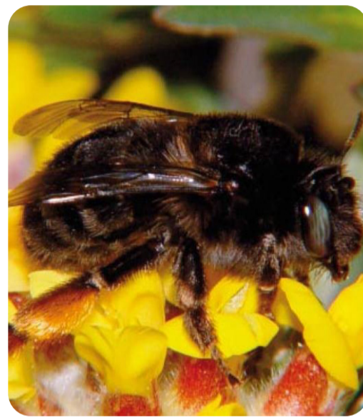
Hona av svartpälsbi.

Vi vill återskapa öppna fläckar med sand och blomrikedom i sydvända, solbelysta vägslänter och dikesrenar på de platser där svartpälsbiet en gång fanns. Genom att göra detta gynnar vi svartpälsbi och många andra hotade arter som lever i samma miljöer.