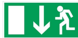
Exempel vägledande markering

Utrymningsvägar och väg till utrymningsväg (t ex korridor) ska vara försedd med vägledande markering, med symboler enligt AFS 2008:13, i form av belysta eller genomlysta skyltar se exempel. Skyltarna ska vara försedda med nød ström via centralt eller lokalt batteri. I lokal, t ex skolsal, där högst 15 personer sover kan avsteg från krav på vägledande markering godtas.