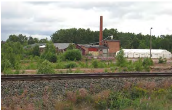
Slipersbolaget från järnvägen