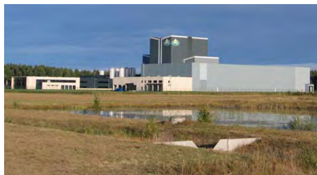
Arla Foods Ingredients AB