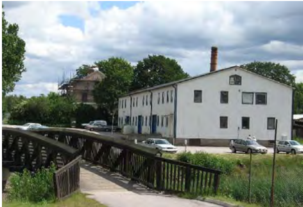
Axel Ståhls möbelfabrik, Åbro