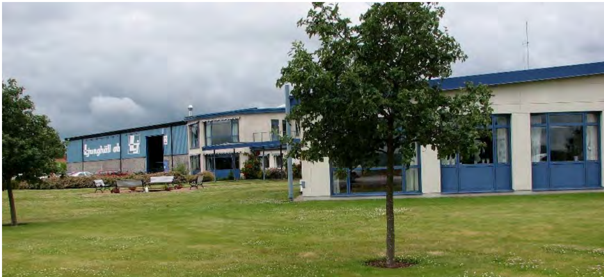
Ljunghäll aluminiumgjuteri i Södra Vi