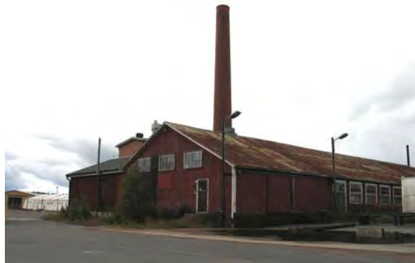
Slipersbolagets/STAB Suecias fabriksbyggnad