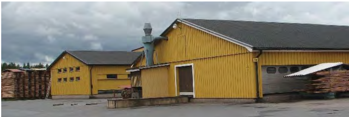
Ansgarius Svenssons sågverk, Vimonsågen