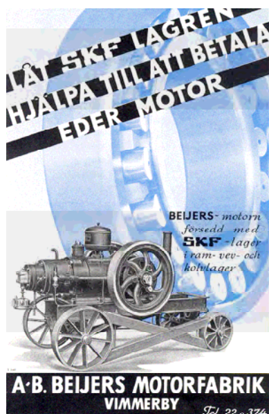
Affisch för Beijers motorfabrik.