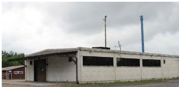
T.h. Södra Vi byggnadssnickerier.