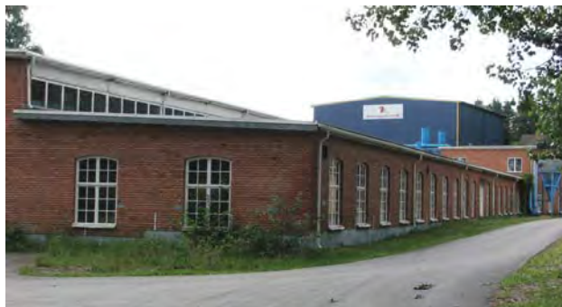
Storebro Bruks mekaniska verkstad vid "Övre Bruket"