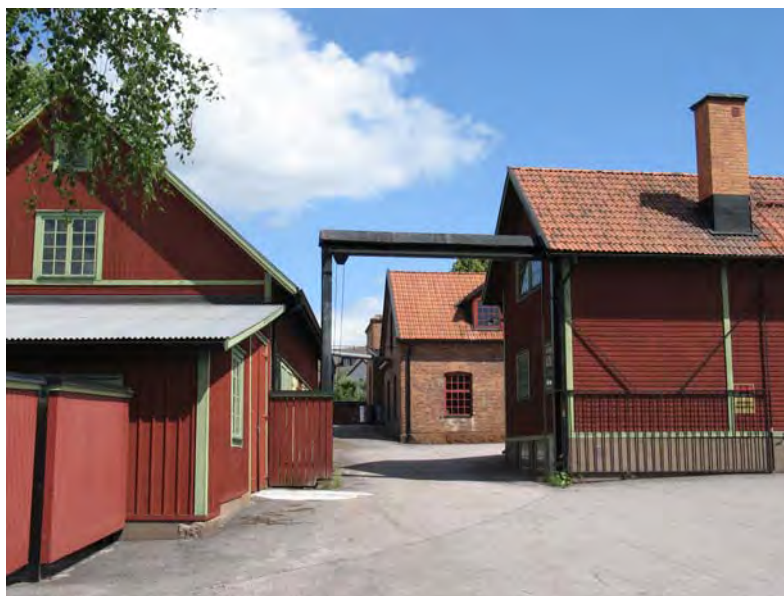
F.d. Beijers motorfabrik i Vimmerby - idag STIMP innovation AB