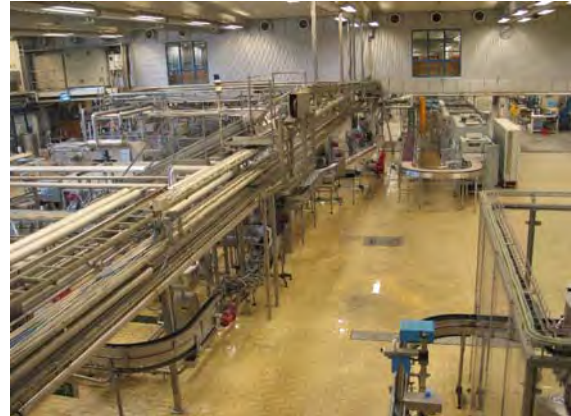
Interiör från Åbro bryggeri