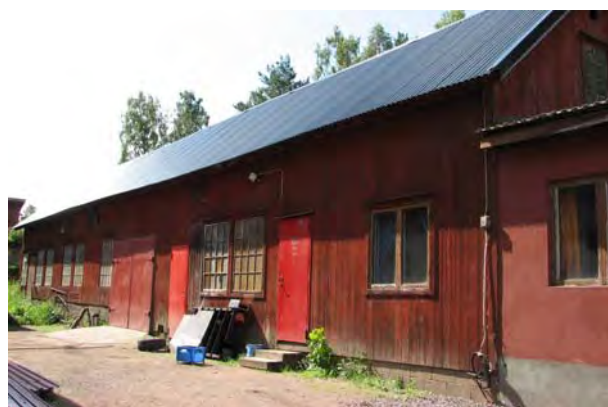
Bülows gjuteri och mek verkst