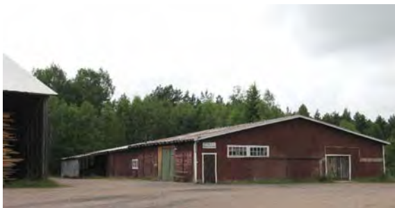
T.v. byggnad som ursprungligen hörde till Södra Vi snickerifabrik.