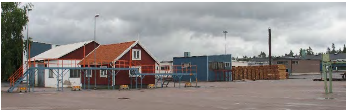
Wernerträ, Gapro i Djursdala