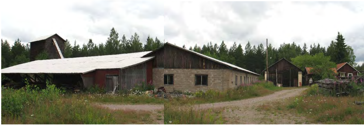
John Johanssons trävaru

avyttrats. Några av dem har kommit att bestå, men då genom att de moderniserats och utökats. Det är därför idag mycket ovanligt med äldre sågverk med utrustningen bevarad, som är så pass stora som Gunnarsmålasågen. Sågverket i Gunnarsmåla bedöms därför ha ett högt kulturhistoriskt värde. Miljön och tekniken samverkar till att ge en tydlig och typisk tidsbild av ett sågverk vid mitten av 1900-talet, som kan ge perspektiv både framåt och bakåt i tiden, inte minst på dagens datoriserade och helautomatiserade sågverkslinjer.