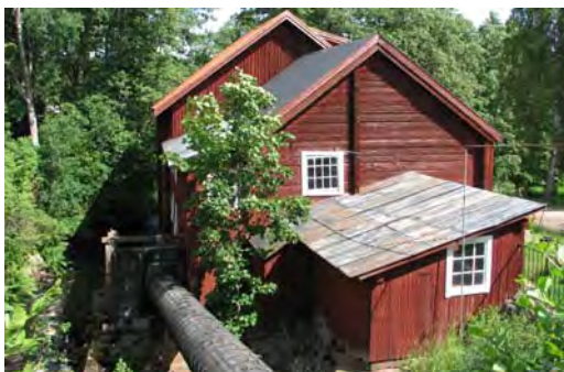
T.v.: Korka smedja med den oinredda snickeriverkstaden på ovanvåningen. T.h.: Korka övre kvarn.