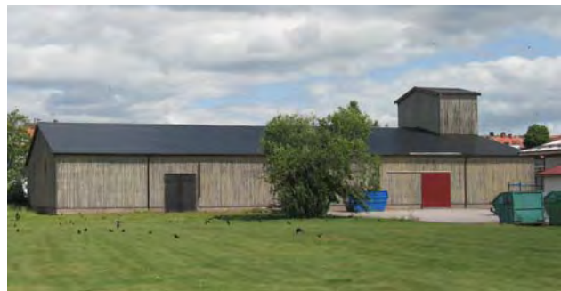
Del av Vimmerby slakteri