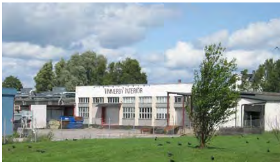
F.d. Elektro-porslin/Installationsmaterial, senare bl.a. Möbelfabriken Ejdern