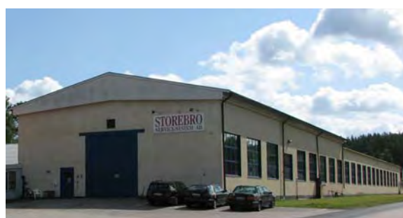
Storebro Bruks mekaniska verkstad vid "Nedre Bruket"