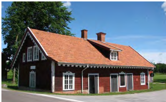
Tuna gamla mejeri