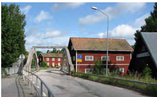
Storebro kvarn och "hammarsmedja" Bruksarbetarbostad i fonden.