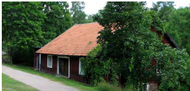
T.v.: Korka mellankvarn med kvarndamm. T.h.: Korka nedre kvarn