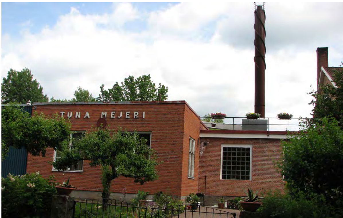
Tuna nya mejeri